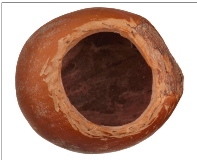
Obr. 3. Škrupina lieskového orecha s charakteristickým ohryzom plšíka lieskového. Vyhľadovaný otvor má hladkú vnútornú hranu a stopy po hlodákoch sú pozdĺžne okolo otvoru. Foto P. Rozsival (prevzaté z práce Húdoková et Adamík, 2011).