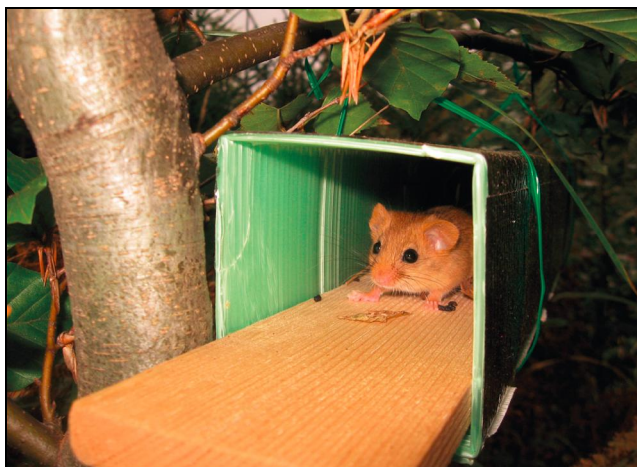
Obr. 2. Tubus obsadený plšíkom lieskovým.