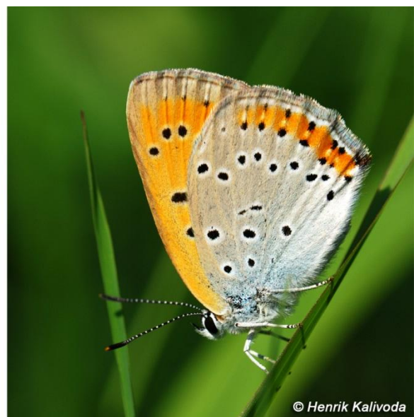
Obr. 2: ohniváček veľký, samica ( Lycaena dispar )