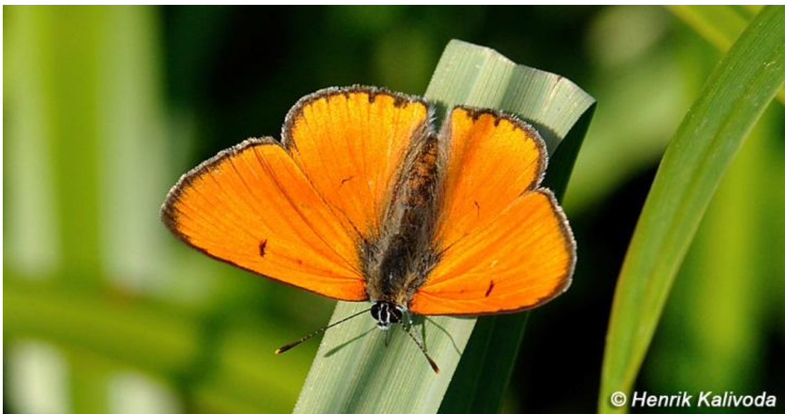
Obr. 1: ohniváček veľký, samec ( Lycaena dispar )

Jedná sa o pomerne ľahko determinovateľný druh, po prípadnom odchytení imága je determinácia bezproblémová.